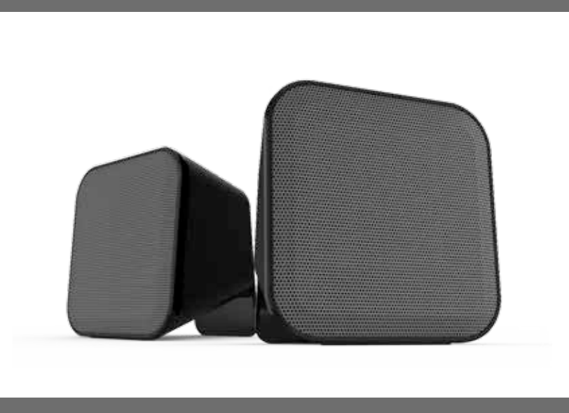
SNAPPY Stereo Speakers

Lead a mobile lifestyle? Then you need some music to go along with it – SNAPPY Stereo Speakers will deliver this wherever you are. Their compact design and low weight make them the perfect companion for your notebook or smartphone – plus, you're freed from the mains as they're USB powered. Thanks to their trendy design, they'll also look good on your desktop – or anywhere where you need big sound in a little package.